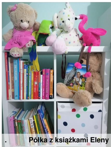
Półka z książkami Eleny

W październiku na stronie fb szkoły ogłoszona została akcja Samorządu Uczniowskiego "Bookshelf tour", czyli pokaz swoją półkę z książkami.