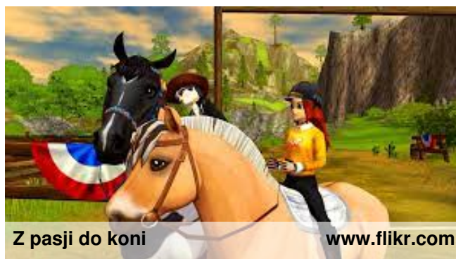
Z pasji do koni