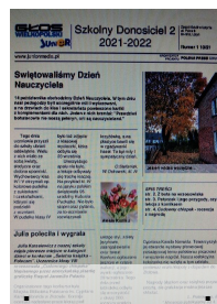
L.Piotrowska kl. V