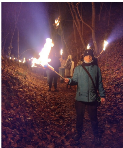
... z pochodniami ekstra!