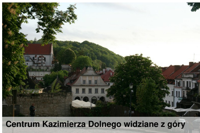
Centrum Kazimierza Dolnego widziane z góry

Pod koniec wycieczki, gdy już brakuje sił, warto wybrać się w rejs po królowej polskich rzek, by ze statku podziwiać miasta Kazimierz oraz Janowiec oraz nacieszyć się towarzystwem krzykliwych mew.