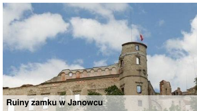
Ruiny zamku w Janowcu

4. Atrakcją rozslawiającą Kazimierz Dolny są wąwozy korzeniowe. Najbardziej znany to Korzeniowy Dół w miejscowości Doły. Jest kręty, malowniczy, z silnie rozwiniętą siecią odsłoniętych korzeni i pni starych drzew. Podczas nocnego zwiedzania Kazimierza odkryłem inny wąwóz lessowy biegnący wzdłuż cmentarza. Moim ulubionym jest wąwóz w pobliżu przeprawy promowej, a ostatnio przeczytałem i zamierzam poznać tzw. ośmiornicę rogowską, czyli sieć wąwozów w okolicach miejscowości Rogów.