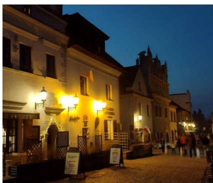
Nocne zwiedzanie Kazimierza jest super! A wąwozów...