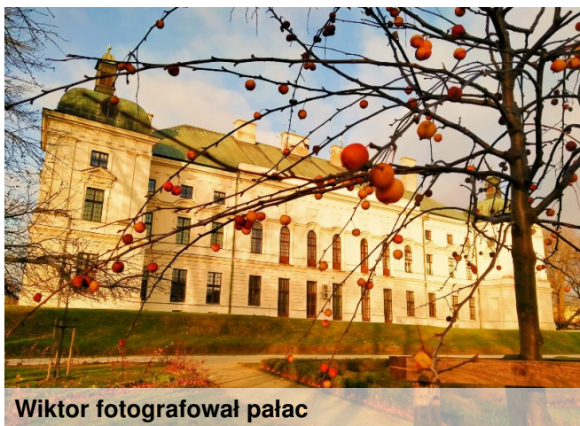
Wiktor fotografował pałac

W niezwykłą podróż po Kazimierzu Dolnym, także fotograficzną, zaprasza Wiktor Kowalski