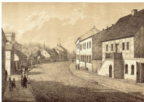
PIŁA (Krajstwo Poznańskie)