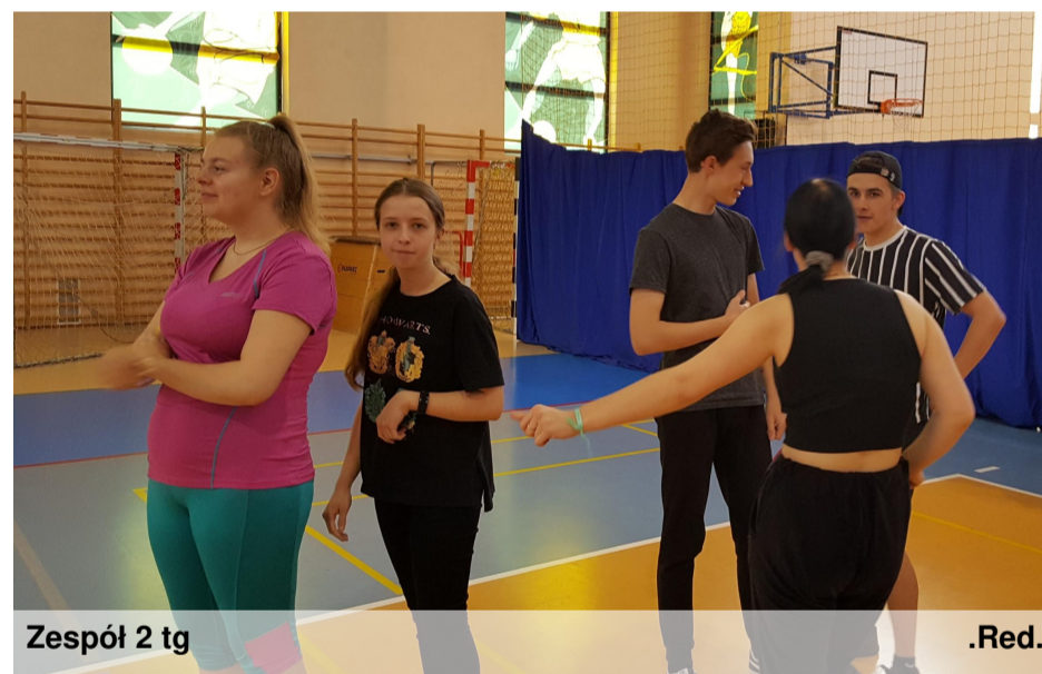
Zespół 2 tg