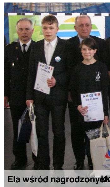
Ela wśród nagrodzonych am