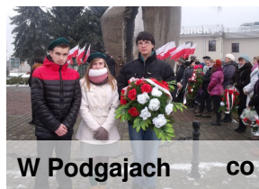
W Podgajach co

Przedstawiciele lotyńskiego Szczepu ZHP wzięli 3 lutego udział w uroczystościach 69. rocznicy powrotu Ziemi Złotowskiej do macierzy. Odbyły się one pod pomnikiem w Podgajach. (red.)