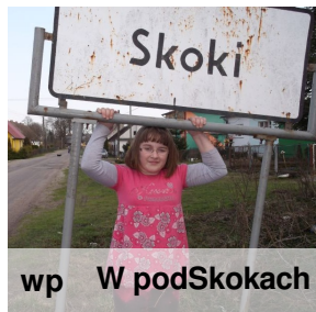
wp W podSkokach