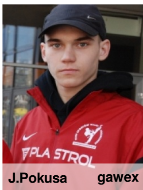
J. Pokusa gawex

8. Blisko 700 rolników uczestniczyło w I Dniach Pola, jakie 28 czerwca zorganizowała firma "Tomar". Ich hasło przewodnie brzmiało: Nie pole rodzi, tylko ten, co po nim chodzi . Przez cały dzień na rolników czekali specjaliści i eksperci, którzy dzielili się swoją wiedzą oraz udzielali specjalistycznych porad w zakresie hodowli zbóż i kukurydzy oraz sprzętu rolniczego. Imprezie towarzyszyły lustracje pól uprawnych i poletek eksperymentalnych oraz wystawa sprzętu rolniczego. Na jej uczestników czekały też wartościowe nagrody.