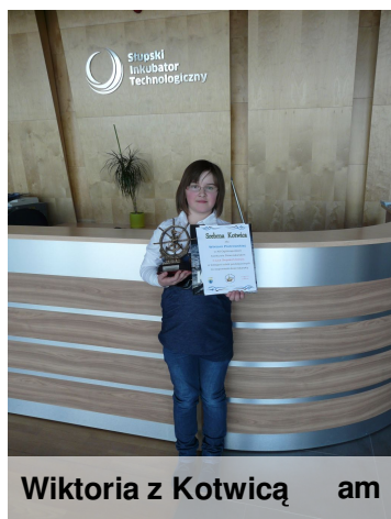
Wiktor z Kotwicą am