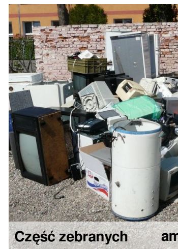
Część zebranych am elektrośmieci