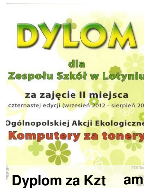
Dyplom za Kzt am

11. Radni Rady Miejskiej w Okonku na wyjazdowym posiedzeniu, które odbyło się w sierpniu w lotyńskiej "Danie", zdecydowali większością głosów o sprzedaży "Hipokratesa". Sprzeciwiło się tej decyzji dwoje miejscowych radnych. Mieszkańcy Lotynia i okolic mieli nadzieję na przeznaczenie tego obiektu na cele publiczne, np. utworzenie w nim ośr. zdrowia.