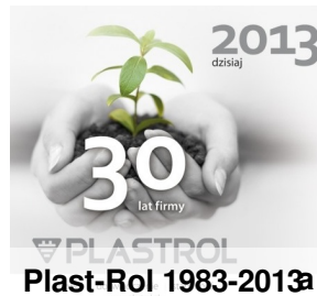
Plast-Rol 1983-2013 am