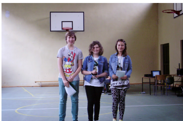
Reprezentacja klasy VI a Zdobywcy I miejsca