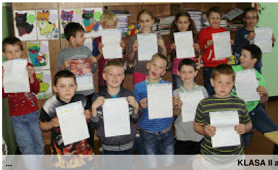
KLASA II a

się do ochrony środowiska np. zbiórka baterii, zbiórka makulatury, zbiórka zepsutych telefonów komórkowych, zbiórka płyt CD, sprzątanie świata i wiele innych. Raz w roku sadzimy także nowe drzewko na terenie szkoły.