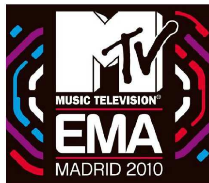
Logo MTV EMA 2010

przez aktorkę Evę Longorię odbyło się w Madrycie w Caja Magica. Oprócz rozdawania nagród wiele nominowanych piosenkarzy wystąpiło na hiszpańskiej scenie,