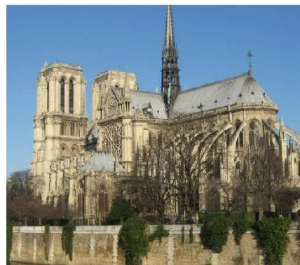
Katedra Notre Dame

do odwiedzania Paryża i nazywania go miastem perfekcyjnym dla ludzi marzących o prawdziwej miłości. Jednak niektórzy podróżują do tego miasta z powodu zabytków i piękna