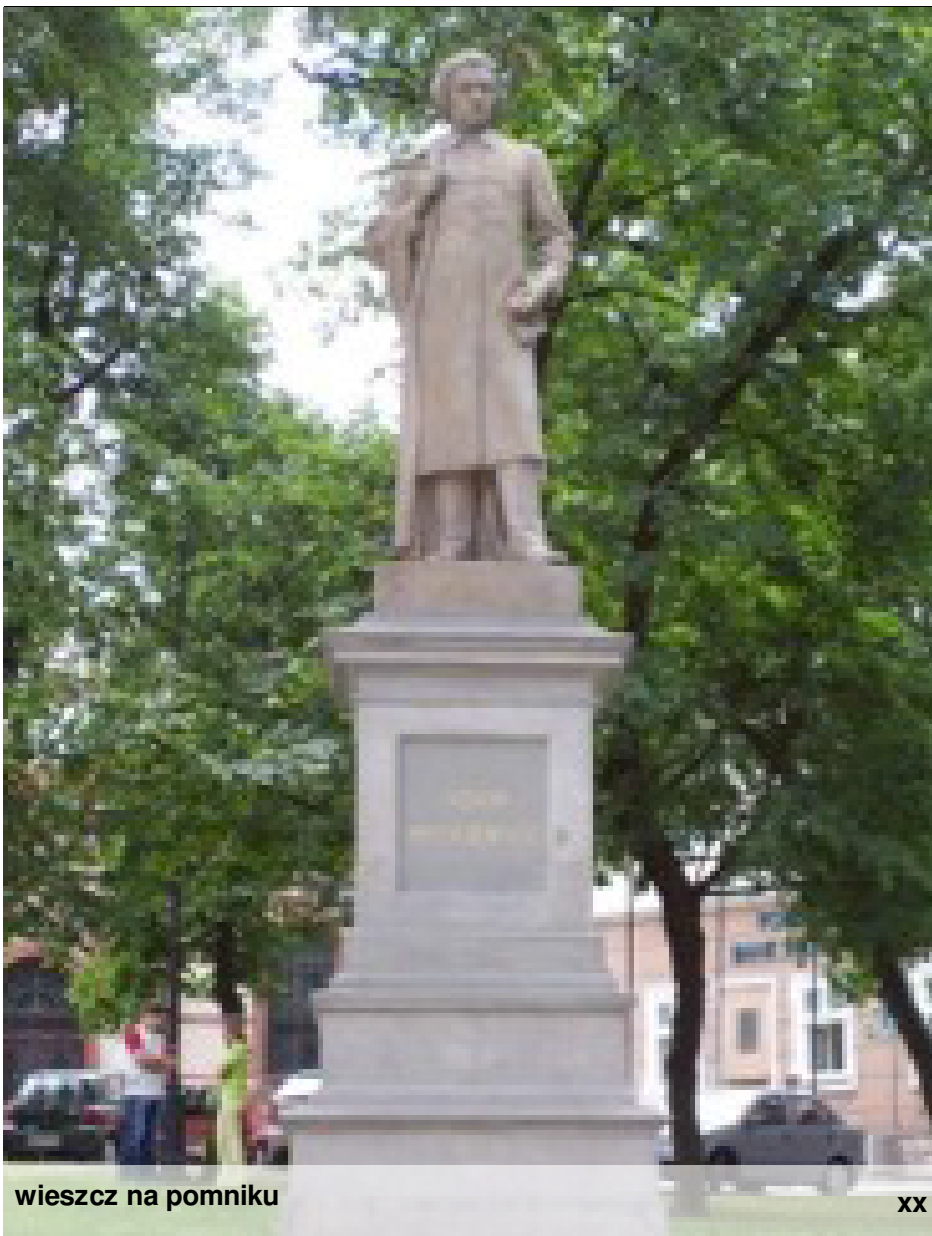
wieszcz na pomniku