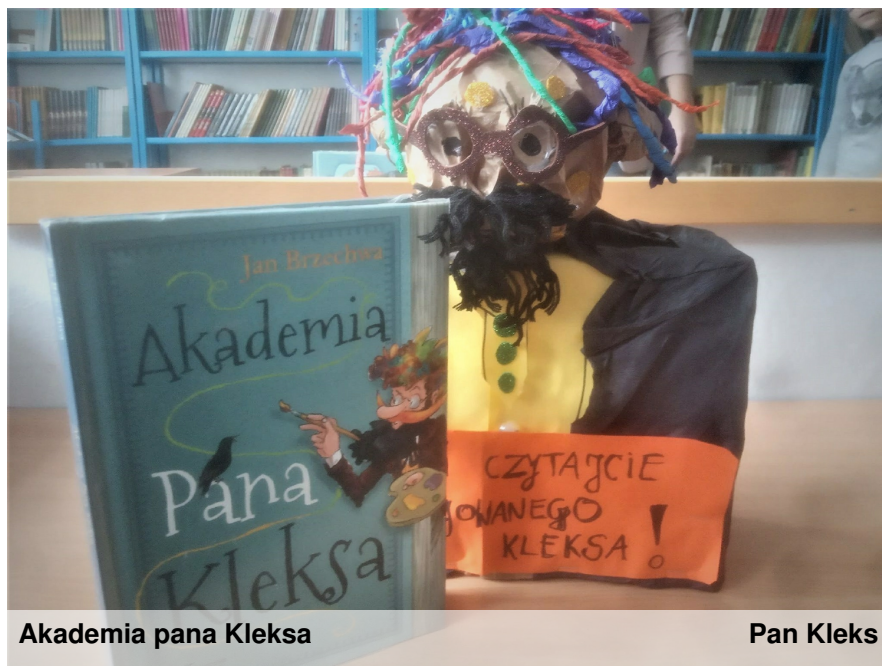
Akademia pana Kleksa