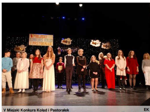
V Miejski Konkurs Kolęd i Pastorałek