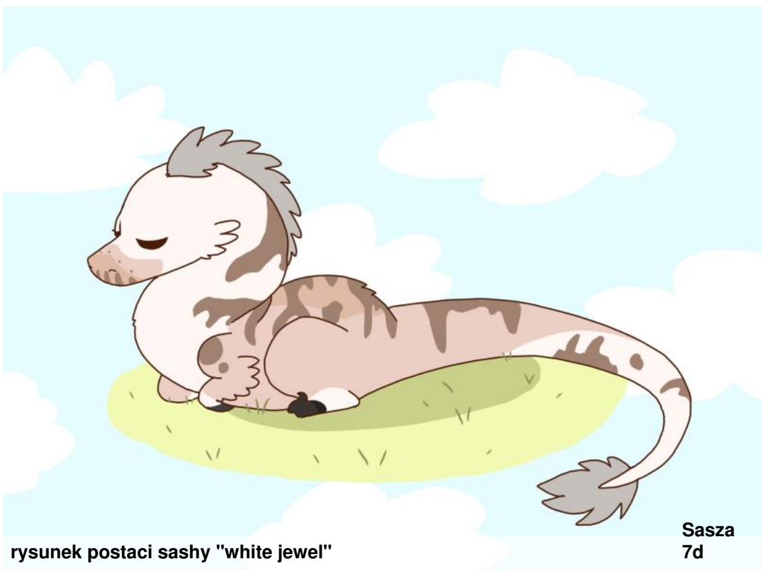
rysunek postaci sashy "white jewel"