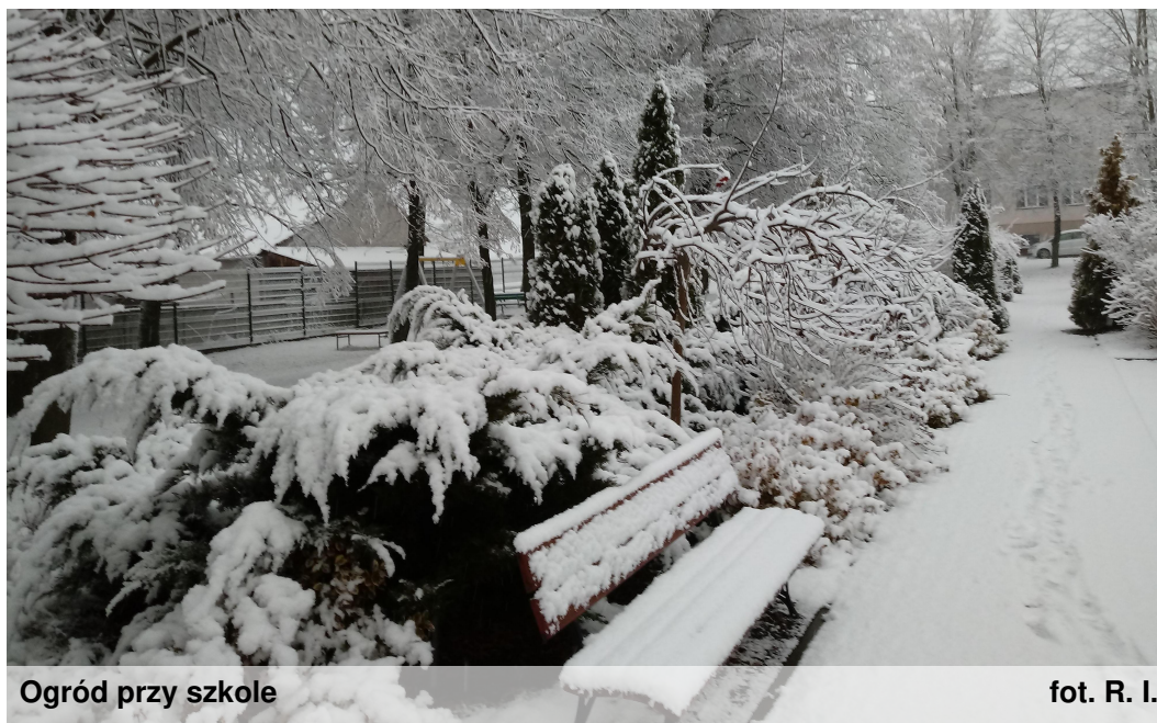
Ogród przy szkole

Nasza zima biała chustą się odziała. Idzie, idzie do nas w gości w srebrnych blaskach cała!