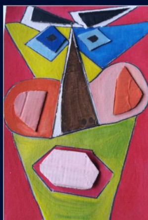
Bartosz Szymkowiak kl. 7g