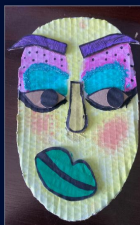
Jakub Polasik kl. 7g

https://view.genial.ly/6087b9e90dc1a00d2ab58b47/presentation-basic-dark-presentation