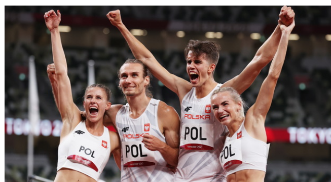
Igrzyska olimpijskie Tokio: Złoty medal polskiej sztafety ...