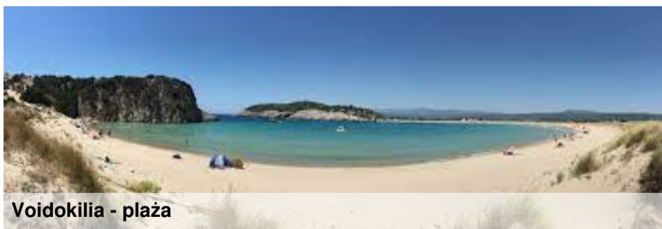
Voidokilia - plaża