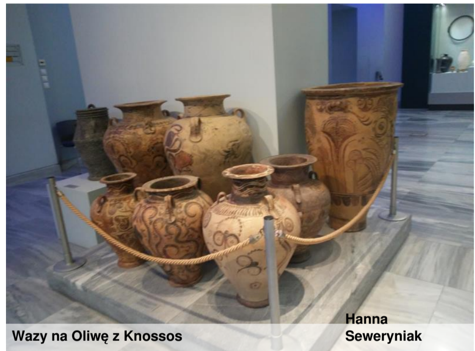
Wazy na Oliwę z Knossos

Na Preveli dociera się autem, a potem przechodzi się męczący spacer, tuż przy tej plaży znajduje się las palmowy, który spłonął, a potem się odrodził.