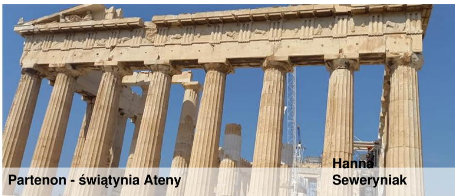
Partenon - świątynia Ateny