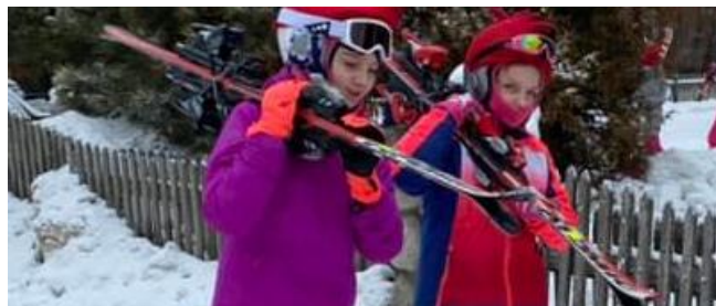
A.G i A.W