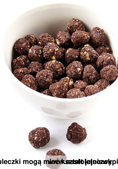
Kuleczki mogą mieć kształt jajeczki. Amelia Mokrzycka