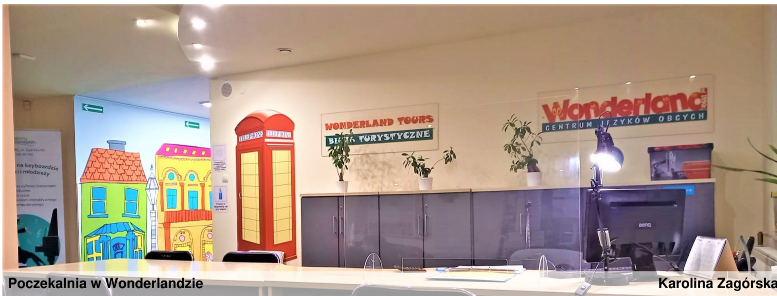
Poczekalnia w Wonderlandzie