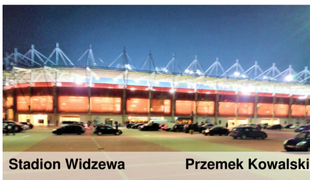
Stadion Widzewa Przemek Kowalski