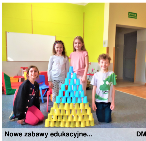
Nowe zabawy edukacyjne...