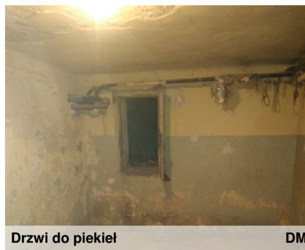
Drzwi do piekieł