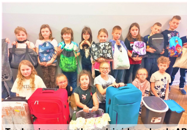
Trochę pomysłu na dzień bez plecaka AP