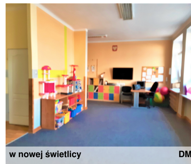
w nowej świetlicy