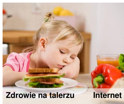
Zdrowie na talerzu