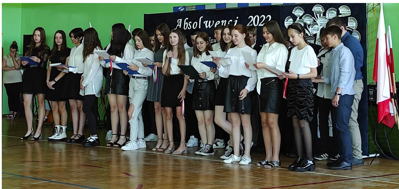
Zakończenie roku szkolnego