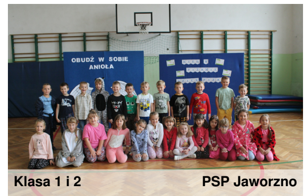
Klasa 1 i 2

W poniedziałek, 26 września 2022 r. w naszej szkole odbył się charytatywny bieg w piżamie pod hasłem "Obudź w sobie anioła". Bieg, jako część ogólnopolskiej akcji organizuje Fundacja "Gdy Liczy się Czas". Dlaczego piżama? Na znak solidarności z dziećmi chorymi na raka. Dzień piżamy zorganizowany był z inicjatywy Samorządu Uczniowskiego, a podczas biegu i różnorakich konkurencji można było wpłacić symboliczną złotówkę na rzecz fundacji. Wszystkim uczestnikom serdecznie dziękujemy.