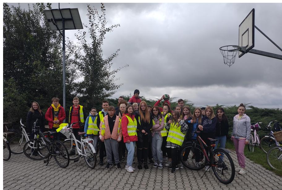
Klasy 7 i 8