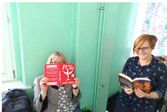
Przerwa na czytanie