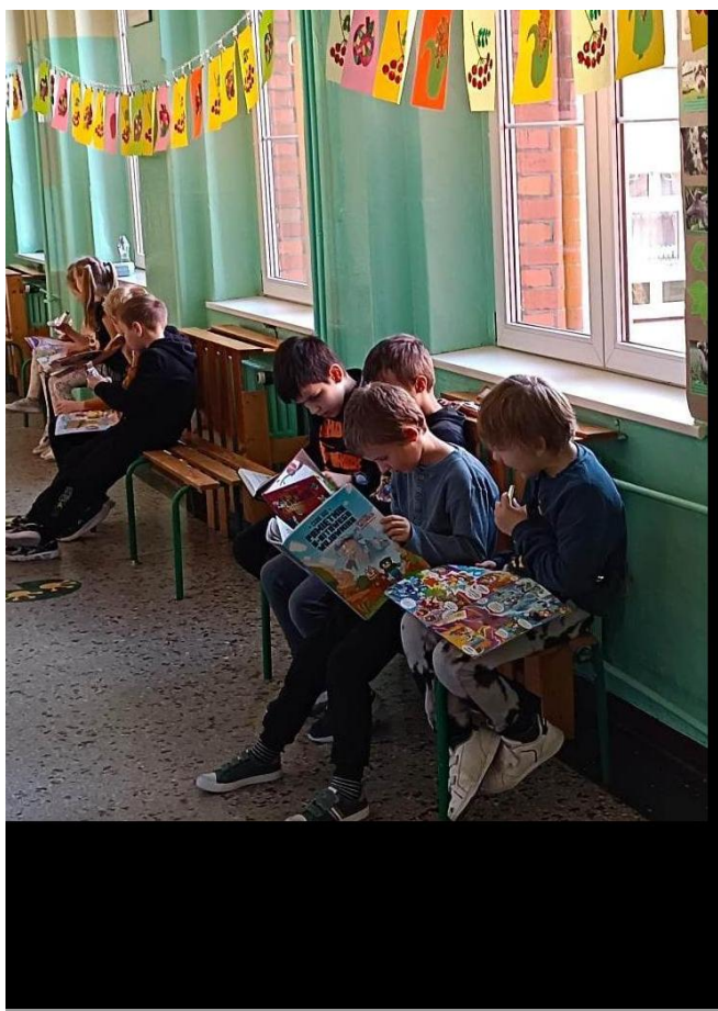
Przerwa na czytanie

Nasza szkoła pod egidą biblioteki szkolnej i SU wzięła udział w VII Ogólnopolskiej akcji „Przerwa na czytanie”, którą organizuje BP WOM w Gorzowie Wielkopolskim. Akcja odbywała się cały tydzień (24 – 28 października). Codziennie podczas długiej przerwy przedstawiciele SU odczytywali fragmenty swoich ulubionych książek przez radiowęzeł, dzięki temu cała szkoła wzięła udział w słuchaniu czytanych opowieści. Uczeń, który pierwszy odgadł tytuł książki i podał go w bibliotece szkolnej otrzymywał nagrodę.