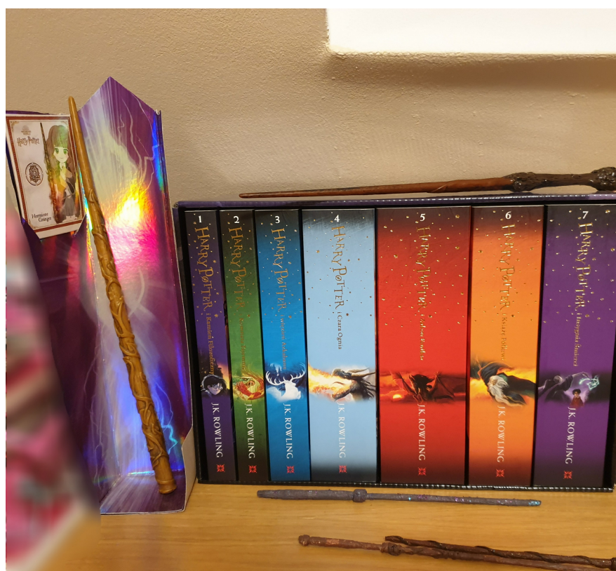
Moja kolekcja :)