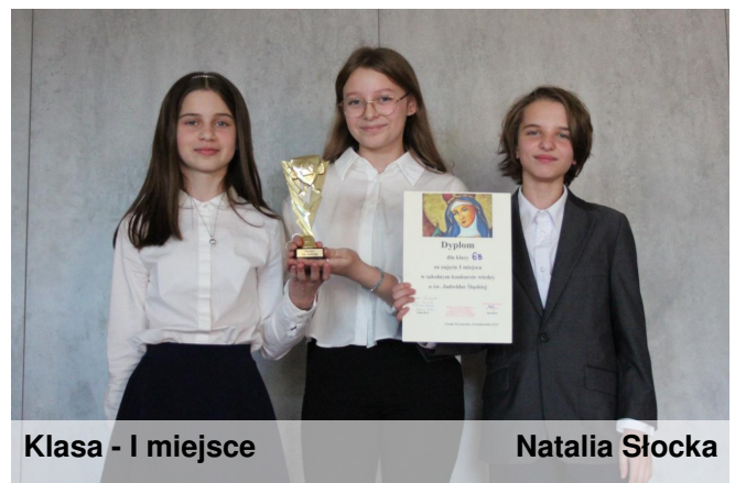
Klasa - I miejsce