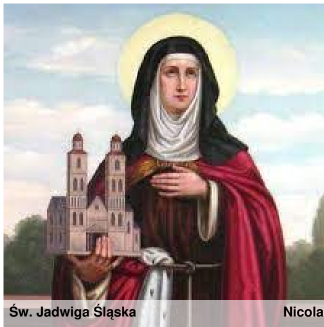
Św. Jadwiga Śląska