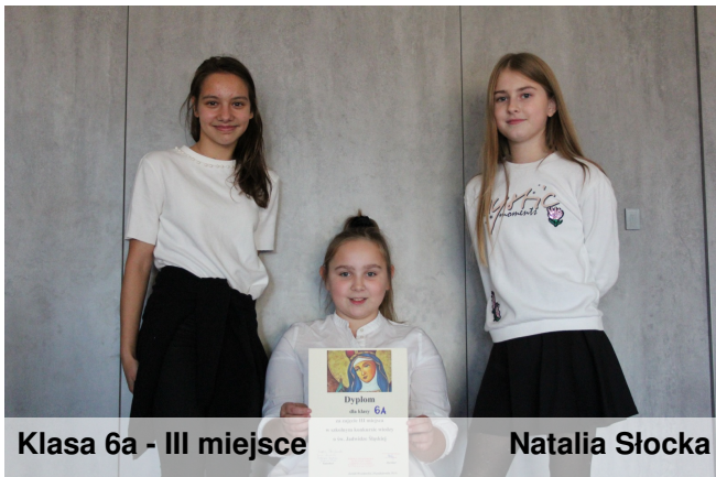
Klasa 6a - III miejsce