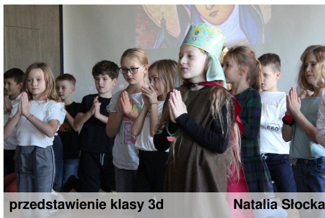
przedstawienie klasy 3d