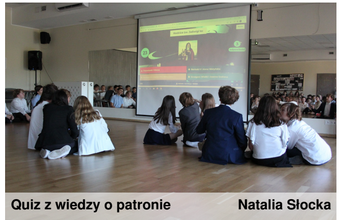
Quiz z wiedzy o patronie