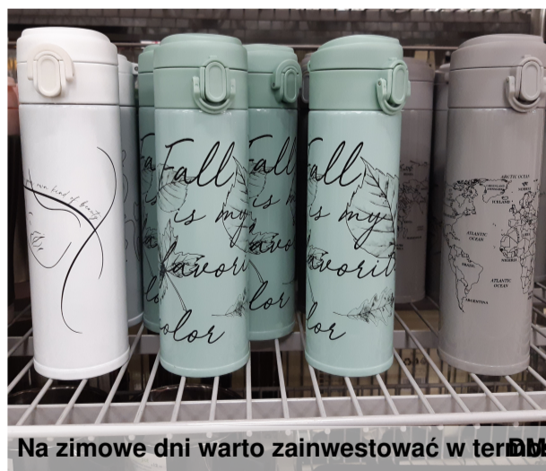
Na zimowe dni warto zainwestować w termos

kupić filtrowaną butelkę. Nie marnujemy tak dużo plastiku. 2. Herbata w termosie Szczególnie dobra jest ona na ciepłe dni, ale jeśli chcecie, by herbata długo trzymała ciepło, radzimy zaopatrzyć się w termos dobrej jakości. 3. Soki owocowe Najlepsze są soki 100%, czyli takie, które są naturalne i zawierają tylko cukier z owoców.