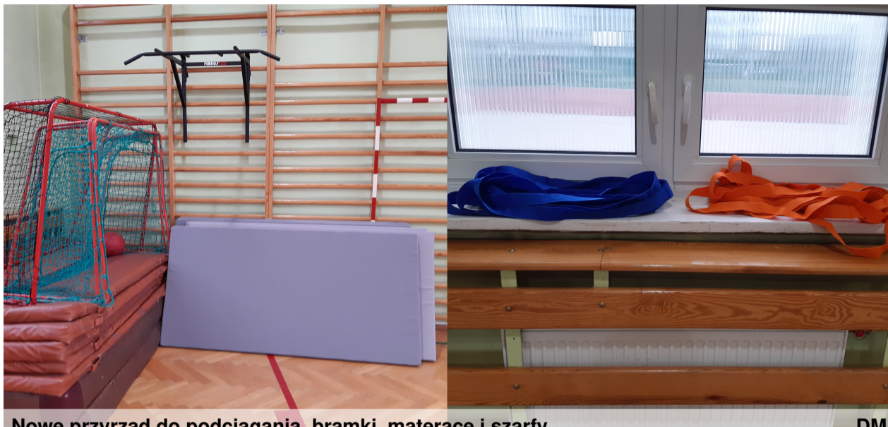
Nowe przyrządy do podciągania, bramki, materace i szarfy