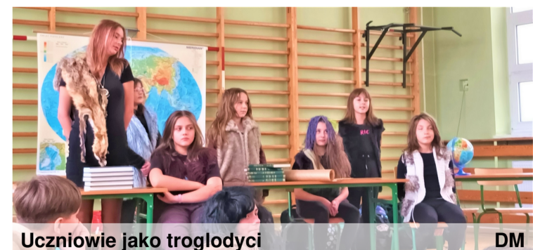
Uczniowie jako troglodyci