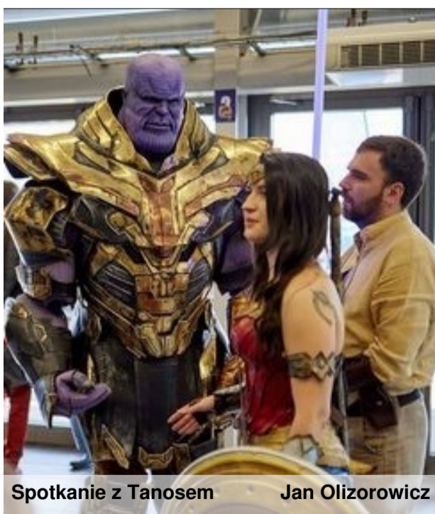
Spotkanie z Tanosem