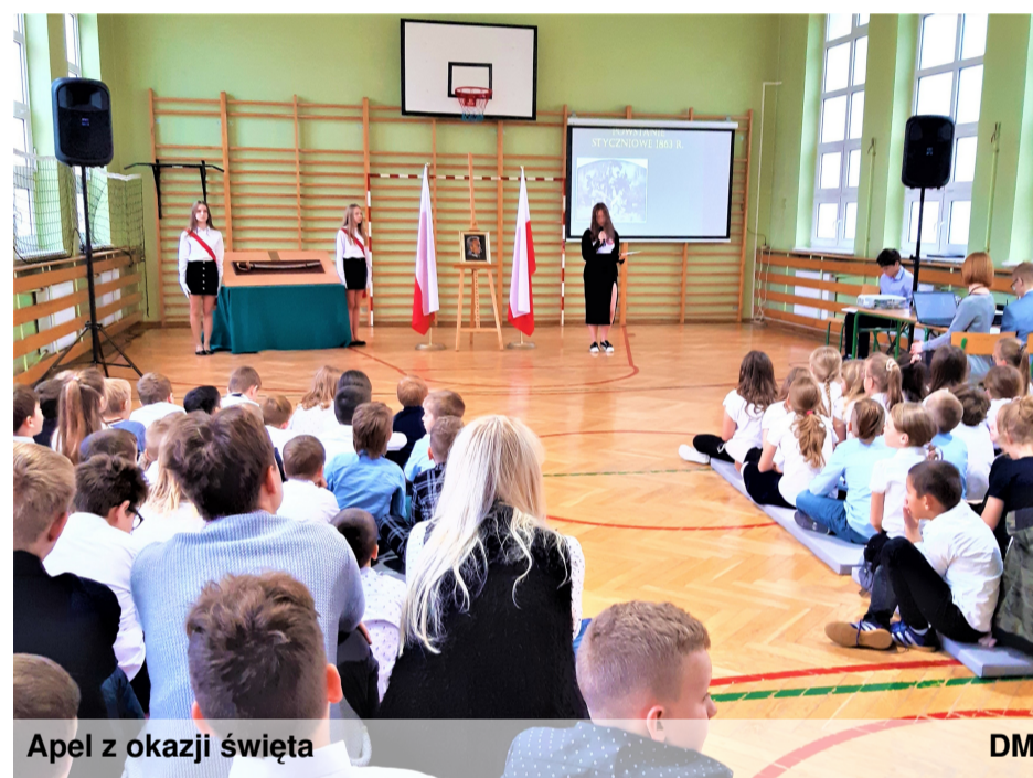
Apel z okazji święta