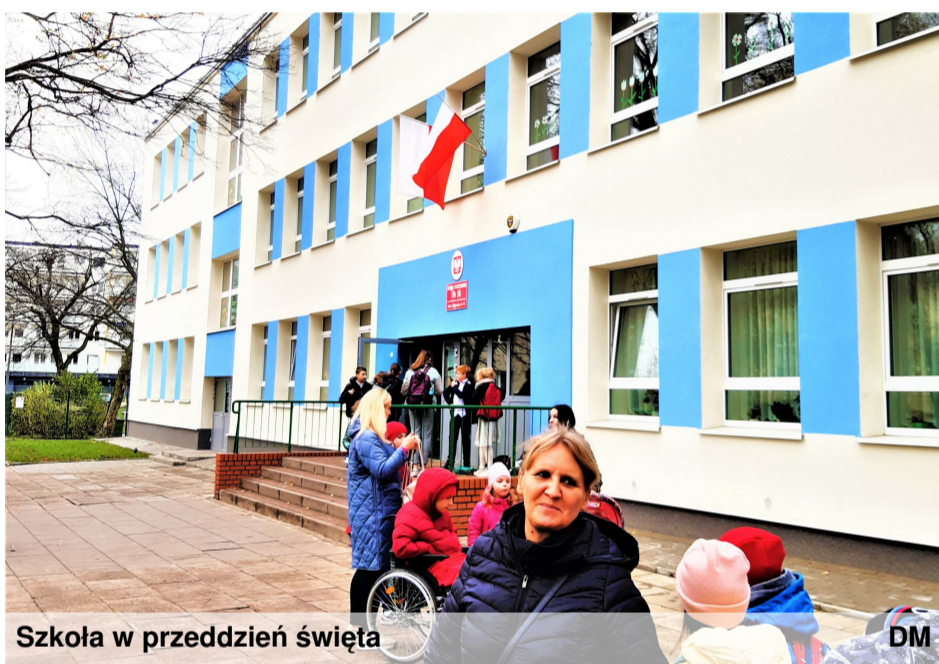
Szkoła w przeddzień święta