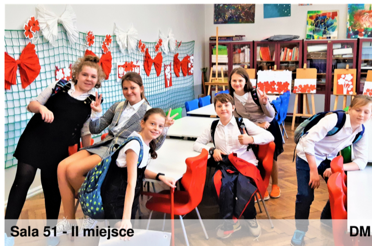
Sala 51 - II miejsce