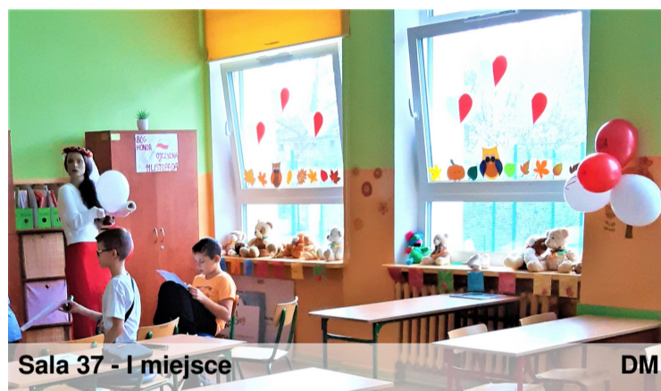
Sala 37 - I miejsce