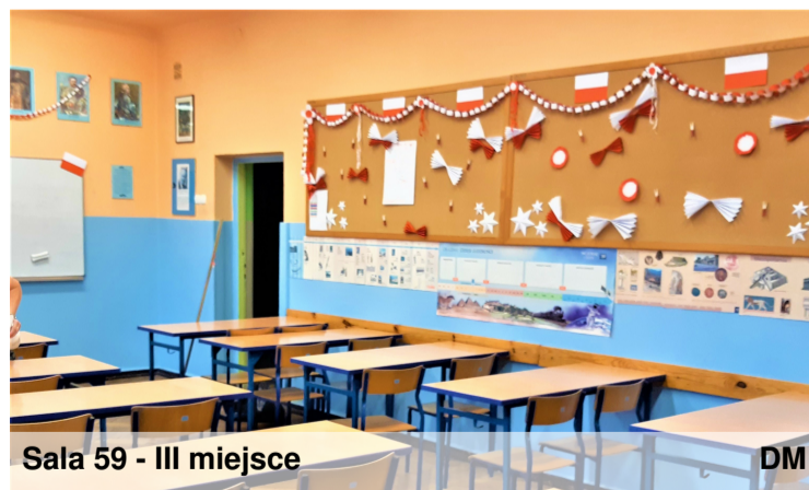
Sala 59 - III miejsce