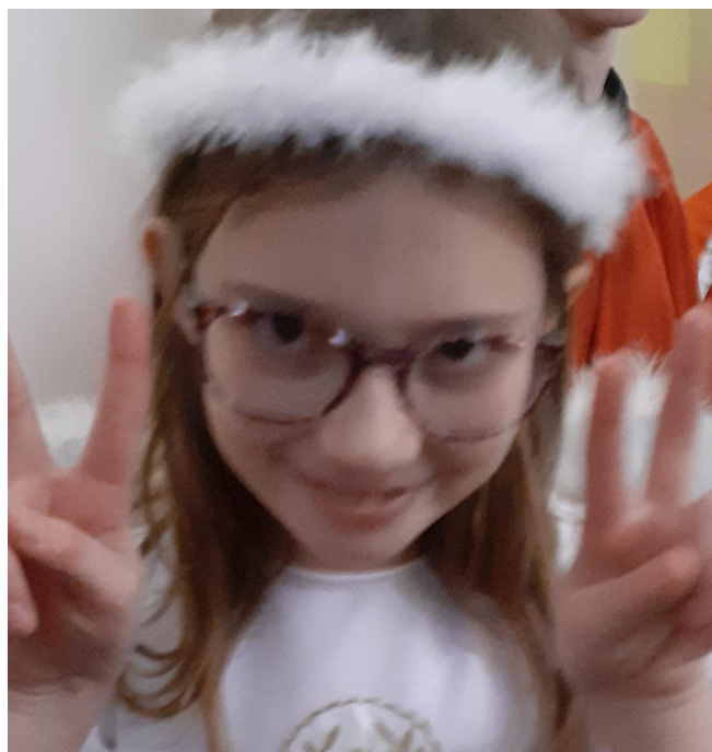
Król, aniołek i pasterze