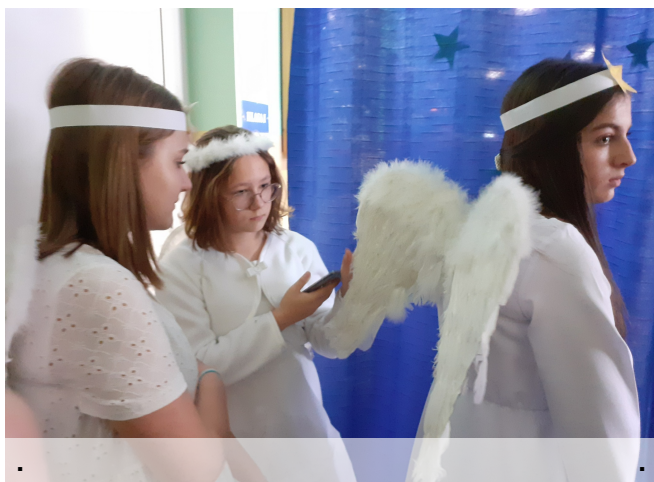
Bardzo piękne aniołki :)