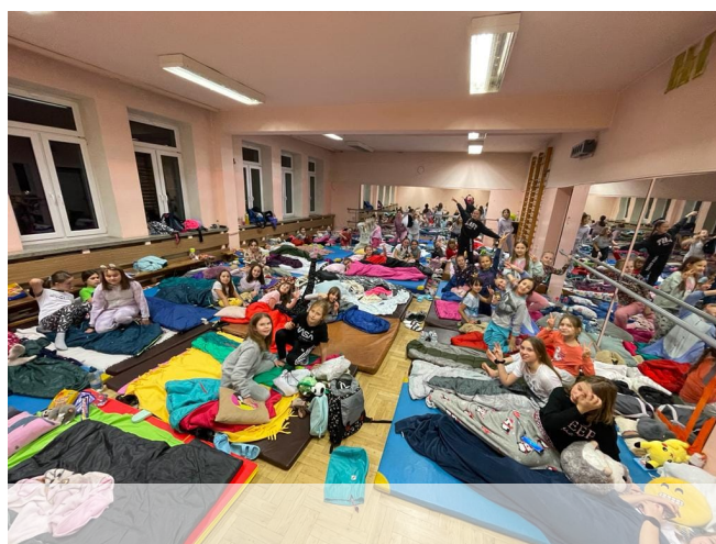
Zosia Niestrój 5b