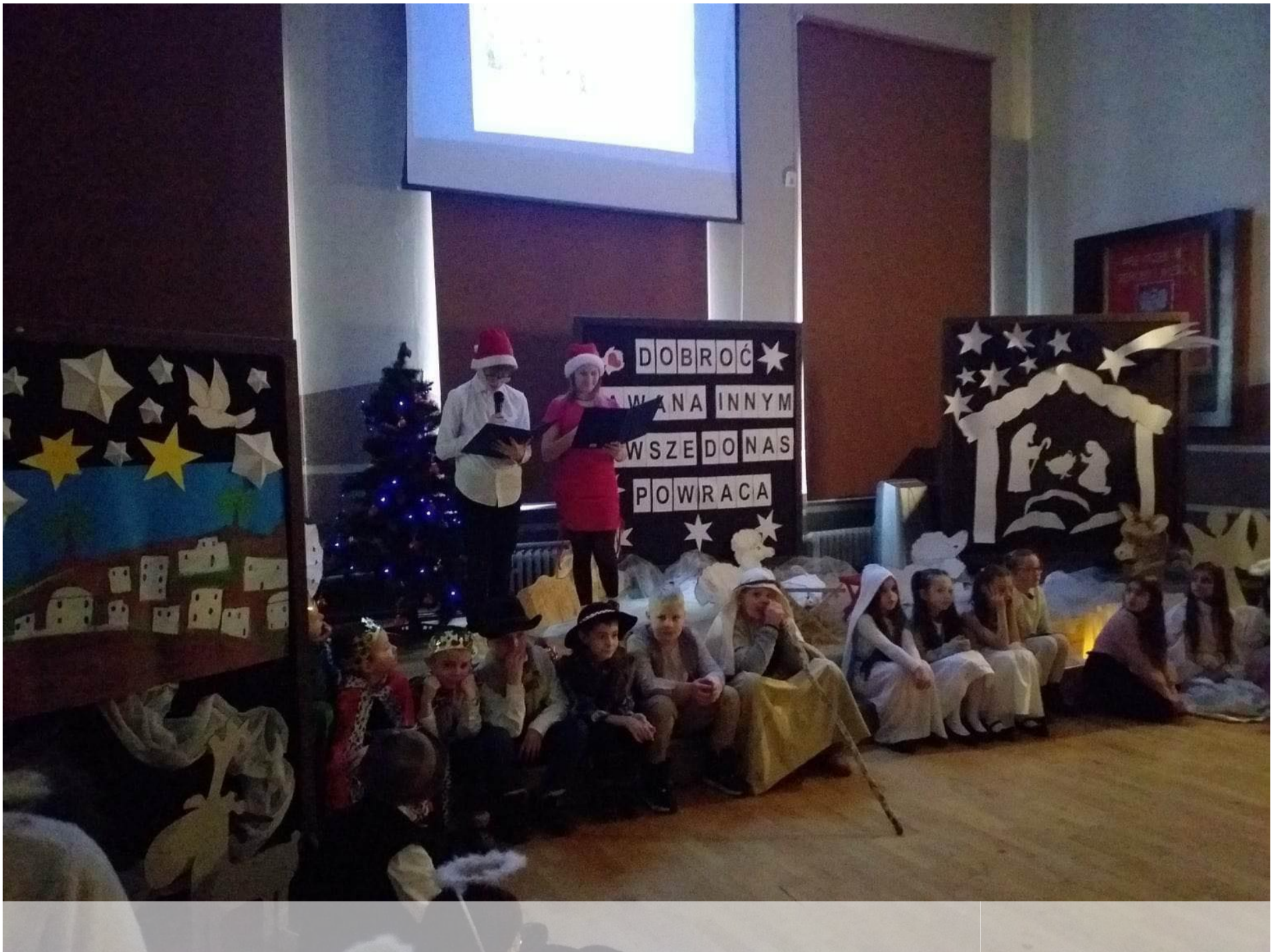
PODSUMOWANIE AKCJI „I TY MOŻESZ ZOSTAĆ ŚWIĘTYM MIKOŁAJEM 2022”