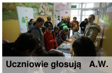
Uczniowie głosują A.W.