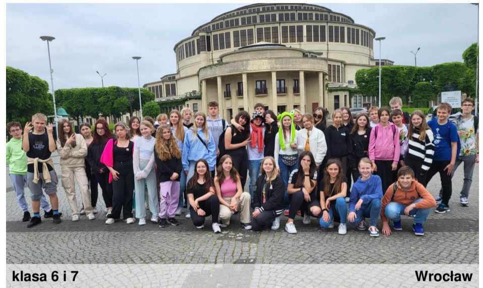
klasa 6 i 7