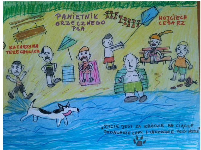
Ilustracja do książki