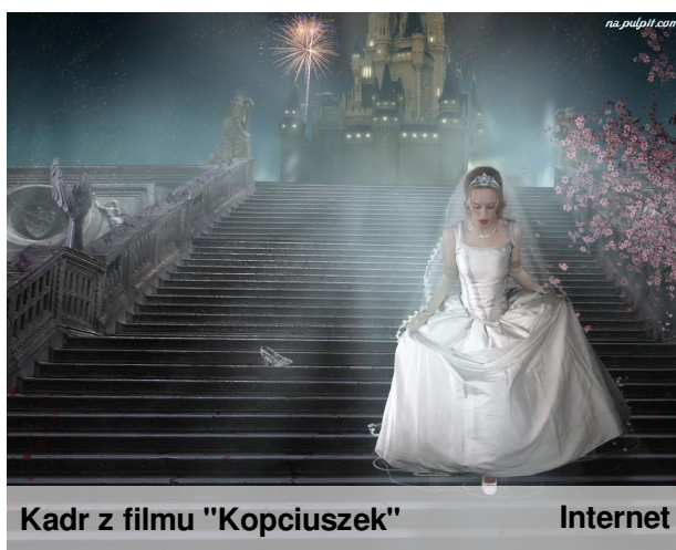
Kadr z filmu "Kopciuszek" Internet