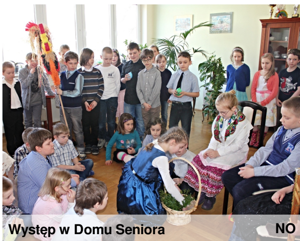
Występ w Domu Seniora