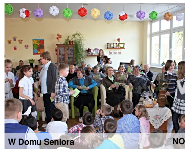
W Domu Seniora