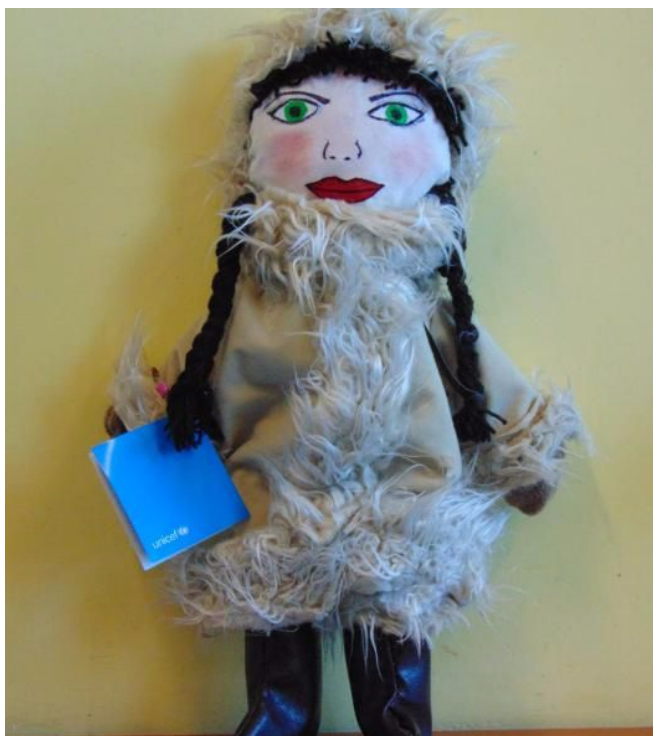
Lalka zgłoszona do konkursu