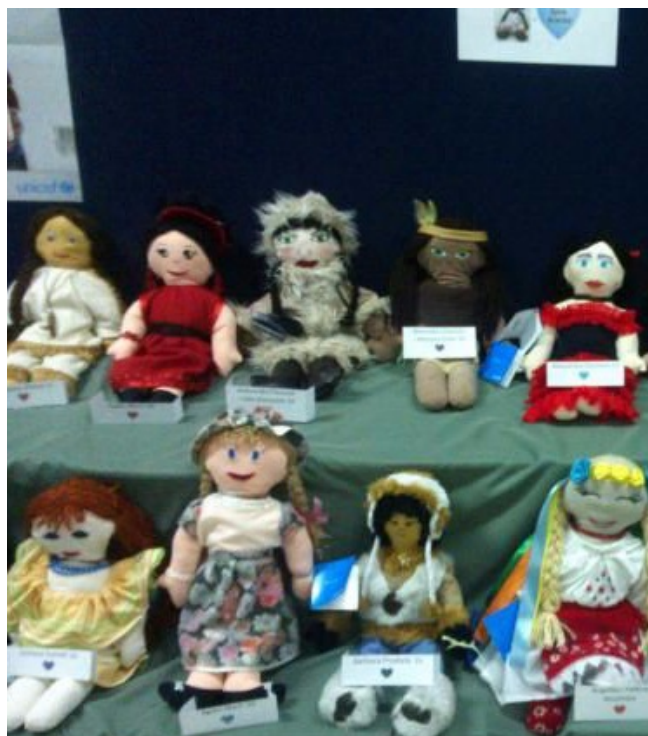
To tylko część laleczek:)