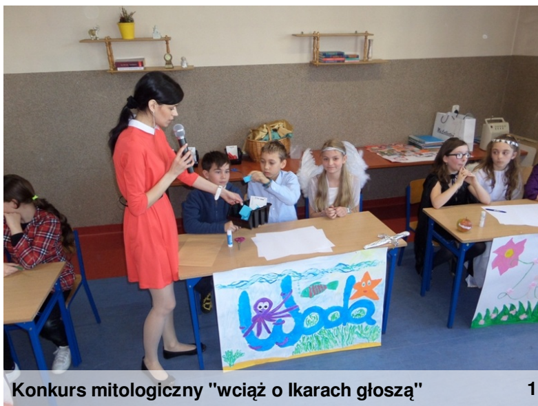
Konkurs mitologiczny "wciąż o Ikarach głoszą"