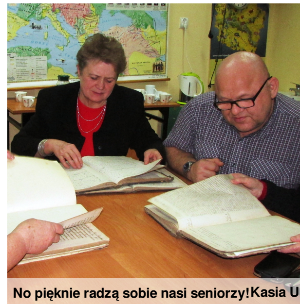
No pięknie radzą sobie nasi seniorzy! Kasia U

projektem, czyli skorowidze osobowe ksiąg parafialnych parafii Łowiczek. Osobom tworzącym drzewo genealogiczne lub piszącym dzieje swych rodzin ułatwią odnalezienie poszukiwanej osoby bez potrzeby przeglądania ksiąg parafialnych. Druga część spotkania była bardziej interesująca, ponieważ seniorzy mieli okazję przekonać się jak trudnego, ale i pożytecznego zadania się podjęliśmy. A nie było ono łatwe, bowiem księgi były pisane mało czytelnym pismem, a od połowy XIX wieku w języku rosyjskim. Często musieliśmy pracować z lupą w ręce, aby cokolwiek odczytać, więc tym bardziej byliśmy dumni gdy seniorzy docenili naszą pracę. Niektórym z nich udało się nawet odnaleźć swoich przodków, co sprawiło nam ogromną satysfakcję, ponieważ po raz pierwszy mogliśmy przekonać się, że nasza praca nie poszła na marne i naprawdę ma sens. Za 3-4 tygodnie już wydrukowane i w wersji elektronicznej trafią do archiwów i na łowickowską plebanię. (Martyna Pawlak)