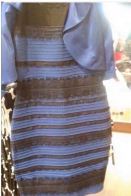
DominikB. entarzy: 104k