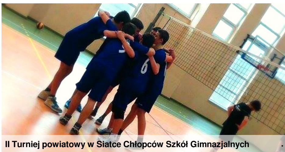
II Turniej powiatowy w Siatce Chłopców Szkół Gimnazjalnych