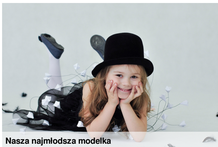
Nasza najmłodsza modelka