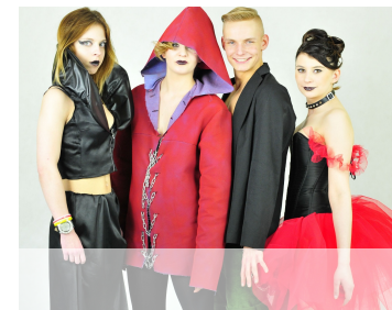
III miejsce kolekcja "Baśnie (nie) na dobranoc"