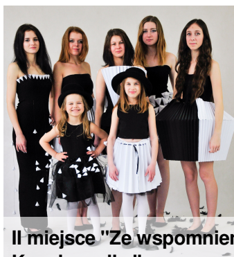
II miejsce "Ze wspomnień Kapelusznika"

autor: Agnieszka Staniek