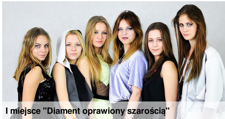
I miejsce "Diament oprawiony szarością"