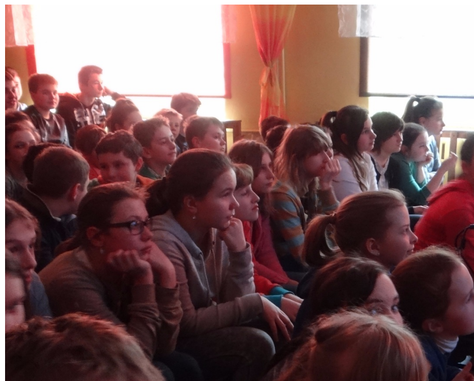
Widzowie - uczniowie szkoły