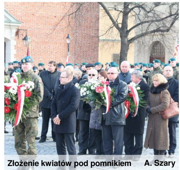
Złożenie kwiatów pod pomnikiem