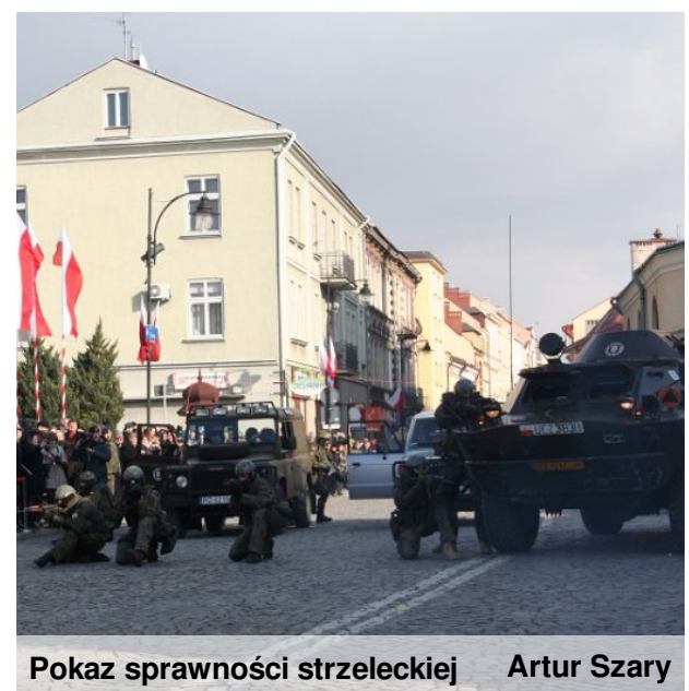
Pokaz sprawności strzeleckiej