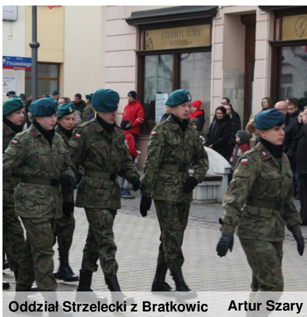
Oddział Strzelecki z Bratkowic