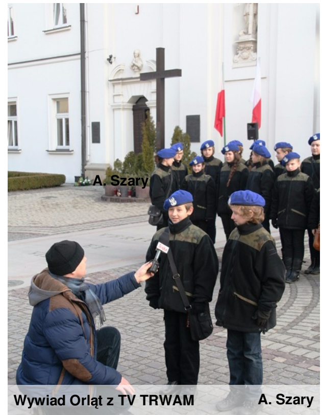
Wywiad Orląt z TV TRWAM