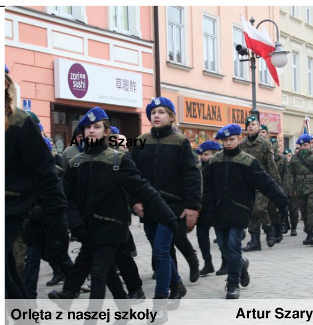
Orląta z naszej szkoły