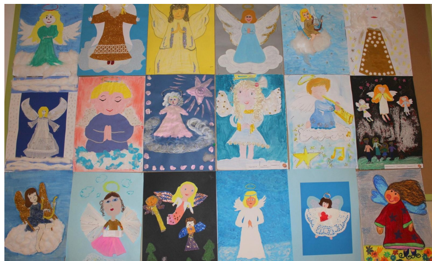
Konkurs "Czuwają nad nami anioły..."