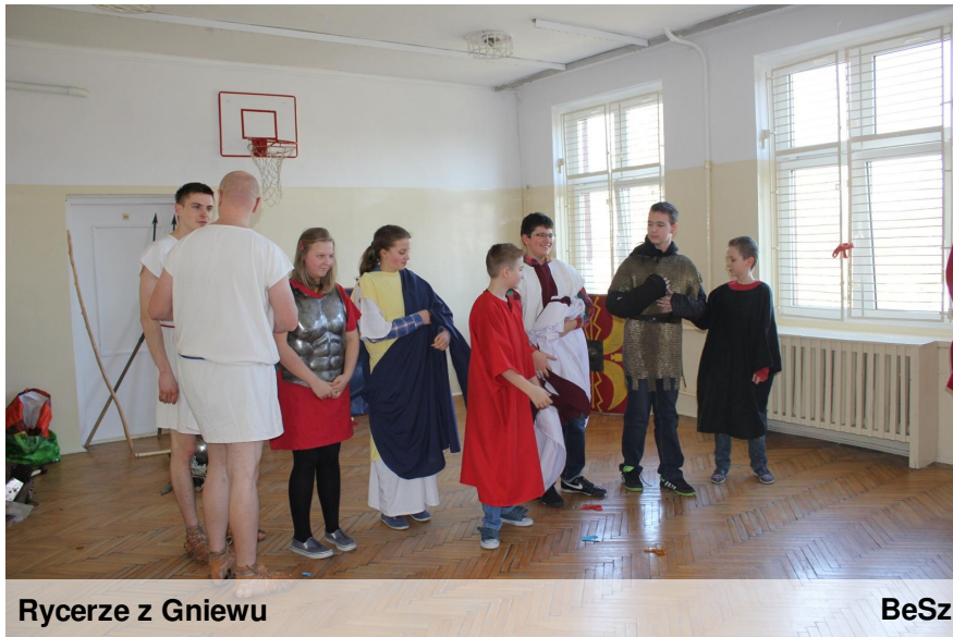
Rycerze z Gniewu

Przed nami długo oczekiwany i zasłużony odpoczynek. Oby tylko pogoda dopisała i za oknem na dobre zawitała zimowa aura. Wyczekujemy ferii z utęsknieniem.