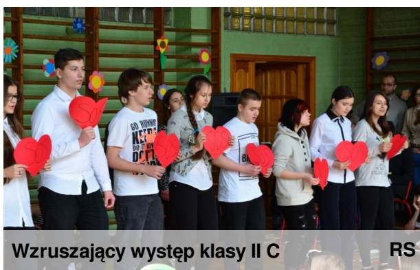
Wzruszający występ klasy II C

z sumą punktów 56 KLASA 1A Gratulujemy!!!