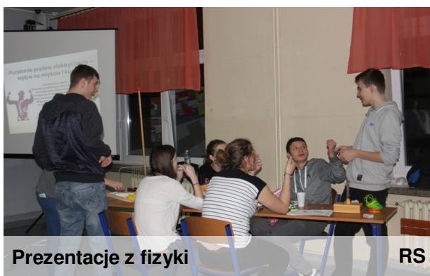
Prezentacje z fizyki