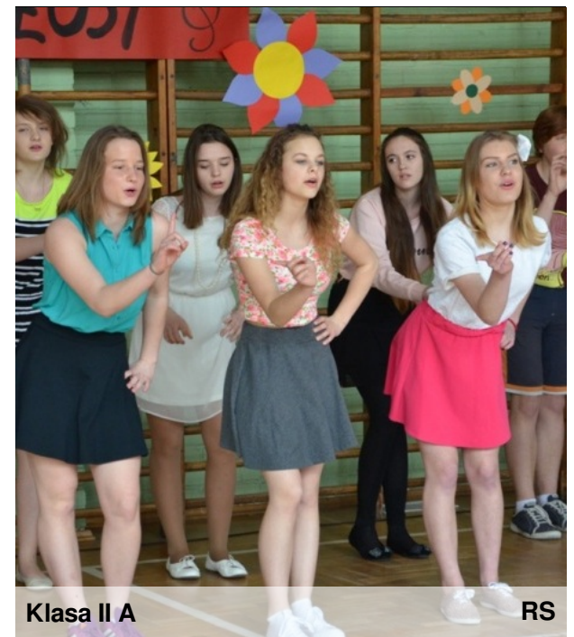
Klasa II A