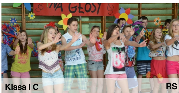
Klasa I C