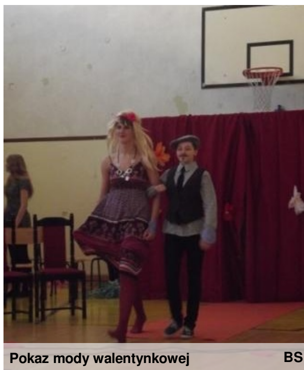
Pokaz mody walentynkowej