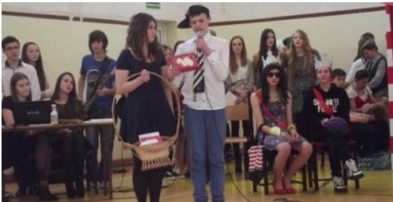
Kocham się w Tobie...