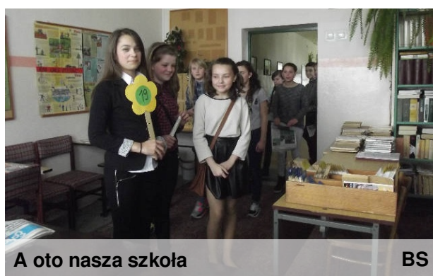
A oto nasza szkoła