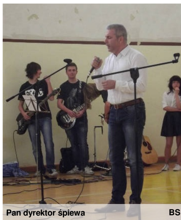
Pan dyrektor śpiewa