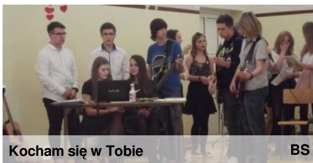
Kocham się w Tobie