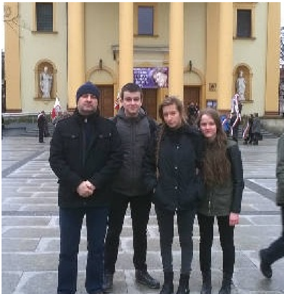
Dzień Żołnierzy Wyklętych