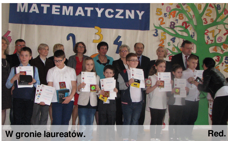
W gronie laureatów.

Obaj są świetni i już od dawna na matematyce rozwiązują specjalnie dla nich przygotowane trudne zadania. Czasami też pomagają innym. BRAWO!