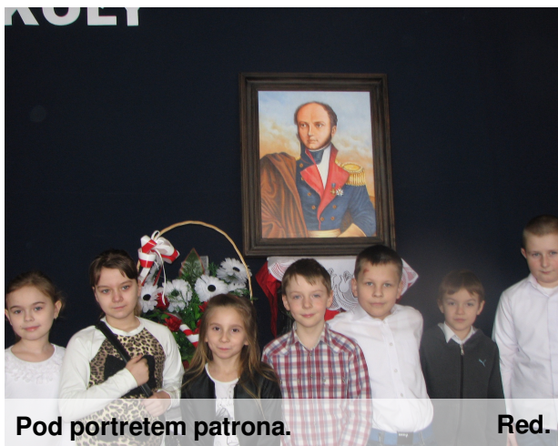
Pod portretem patrona.