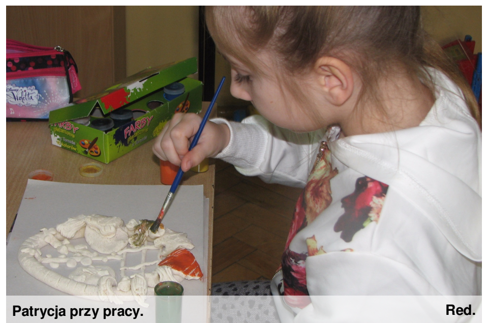
Patrycja przy pracy.