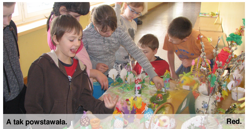
A tak powstawała.