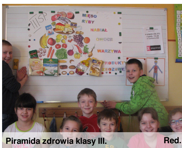
Piramida zdrowia klasy III.