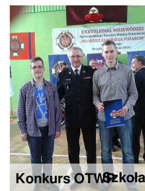
Konkurs OTWP Szkoła