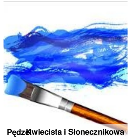
Pędzle Kwiecista i Słonecznikowa