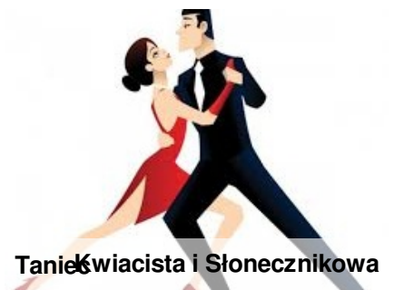
Taniec Kwiecista i Słonecznikowa