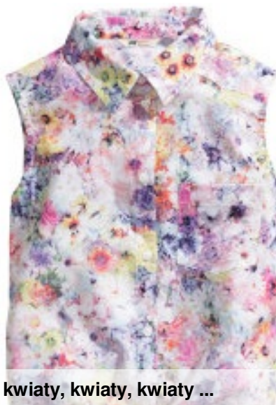
kwiaty, kwiaty, kwiaty ...

Wiosną temperatury wzrastają, a co za tym idzie ubieramy się coraz lżej. Jednak nie możemy zapomnieć o nakryciach wierzchnych. Wiosna kojarzy nam się z kolorowymi kwiatami, warto je także umieścić w naszym stroju. Na te piękne kwiatuszki można założyć także jeansową katanę.