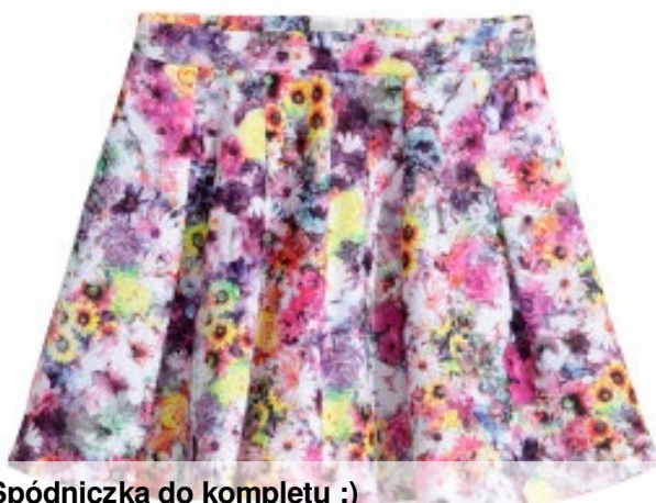
Spódniczka do kompletu :)