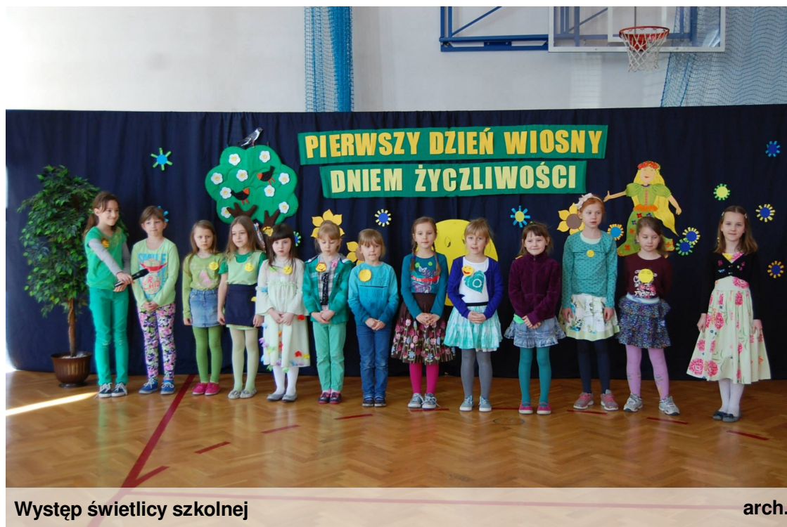
Występ świetlicy szkolnej