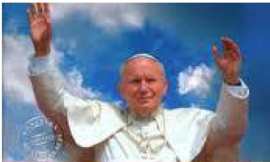
Błogosławiony Jan Paweł II

W czasie swego prawie 27-letniego pontyfikatu Jan Paweł II odwiedził Polskę dziewięć razy w latach: 1979, 1983, 1987, w roku 1991 - dwukrotnie (w czerwcu i sierpniu), następnie w latach 1995, 1997, 1999 i w 2002 roku.