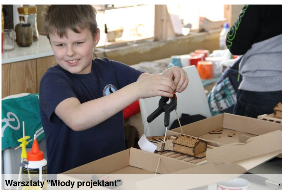
Warsztaty "Młody projektant"