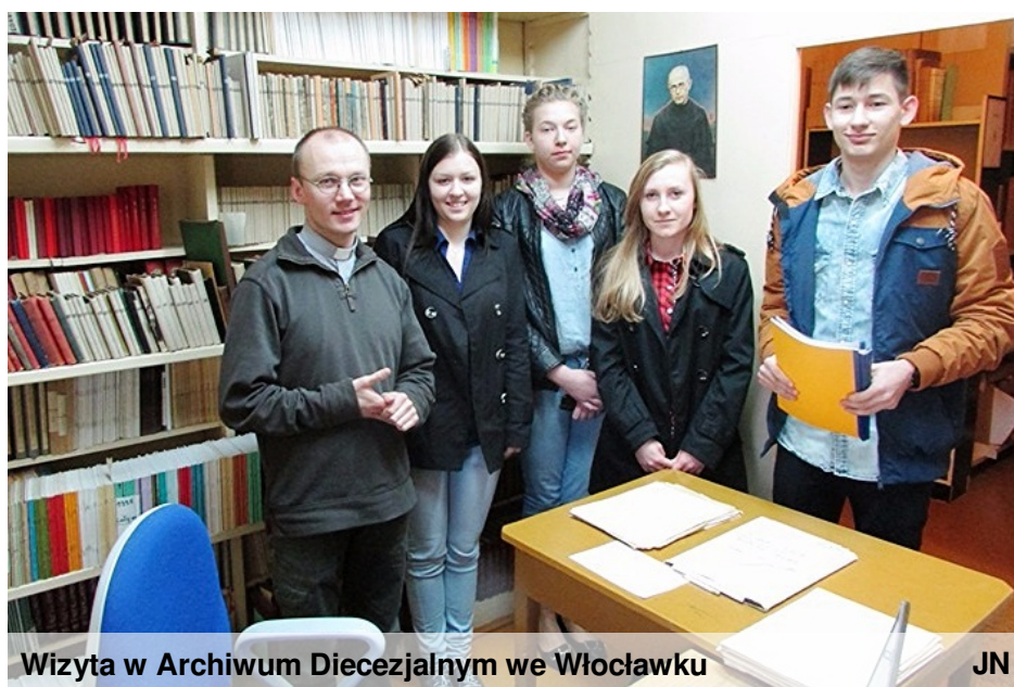
Wizyta w Archiwum Diecezjalnym we Włocławku