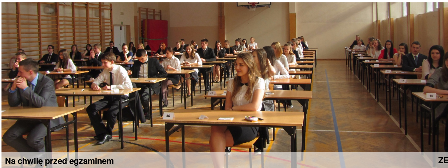
Na chwilę przed egzaminem

Nasz trzeci numer rodził się w wielkich bólach. Egzaminy gimnazjalne i przygotowania do nich mocno utrudniły nam prace redakcyjne. Dodatkowym utrudnieniem było zakończenie dwóch dużych projektów. Ale najmocniej nasze skrzydła podcięły utrudnienia z głosowaniem na numer 2 – na stronie do głosowania był nieaktywny numer 1, a nie wszyscy trafili na stronę 5, aby móc głosować, dlatego drugiego numeru w druku nie będzie – o głosowanie na numer 3 – już prosimy.