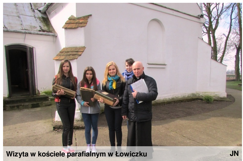
Wizyta w kościele parafialnym w Łowiczku